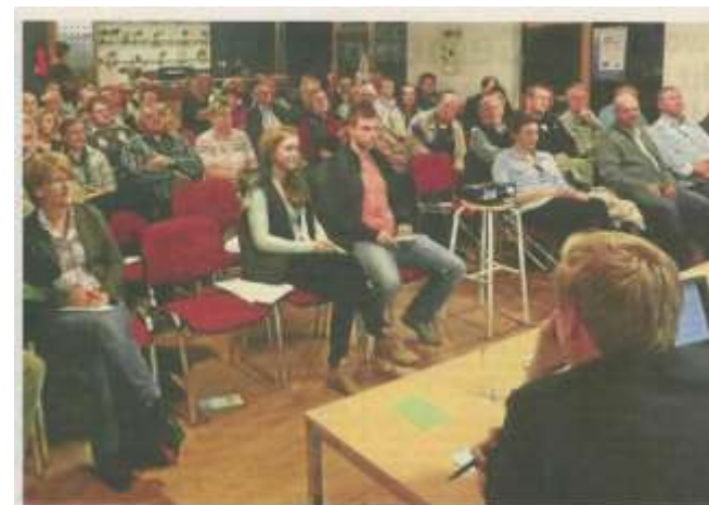
Band 18 Ickerner Ritzler am Montag bei der Vereinsgründung von „Mein Ickern“, einem Mitgliedsbeitrag aus.